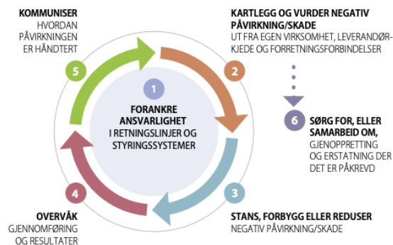
FIGUR 1. AKTSOMHETSVALDERINGSPROSSESEN OG STØTTETILTAK

H&L benytter "OECDs veileder for aktsomhetsvurderinger for ansvarlig næringsliv" 1 som grunnlag for sin aktsomhetsvurderingsprosess. Målet er å identifisere områder i leverandørkjeden som trenger grundigere risikoanalyse.